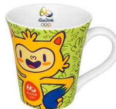
Caneca R$ 31,90