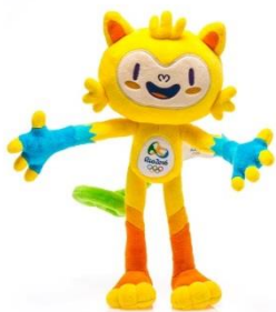
Mascote Olimpíadas R$ 99,90

Joana acessou o site oficial “Loja Rio 2016” e ficou encantada com os produtos oficiais das Olimpíadas. Decidiu comprar alguns itens para sua família. Comprou 02 mascotes, 03 camisetas, 06 canecas, 04 cadernos, 01 bola e 01 game.