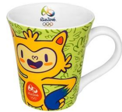
Caneca R$ 31,90