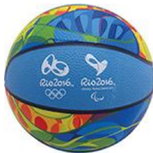
Mini Bola Basquete R$ 49,90