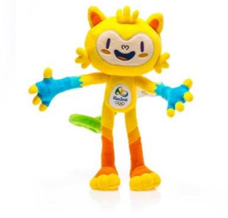
Mascote Olimpíadas R$ 99,90

Joana acessou o site oficial “Loja Rio 2016” e ficou encantada com os produtos oficiais das Olimpíadas. Decidiu comprar alguns itens para sua família. Comprou 02 mascotes, 03 camisetas, 06 canecas, 04 cadernos, 01 bola e 01 game.