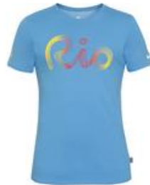
Camiseta R$ 99,90