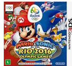
Game Mario & Sonic R$ 229,90